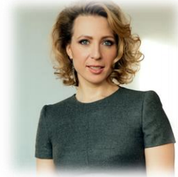
СОПРЕДСЕДАТЕЛЬ ОРГАНИЗАЦИИ: ЧУРИКОВА Яна Алексеевна российская телеведущая, журналист, руководитель каналов молодёжного вещания холдинга Viacom.