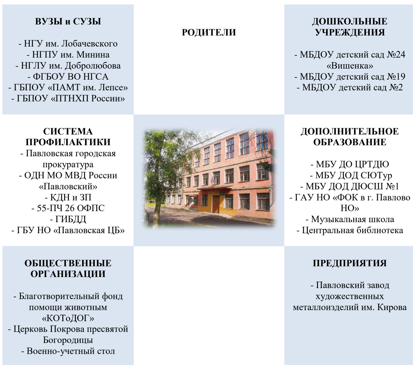
Схема взаимодействия реализации воспитательного процесса

Для организации и полноценного функционирования такого образовательного процесса требуются согласованные усилия многих социальных субъектов.